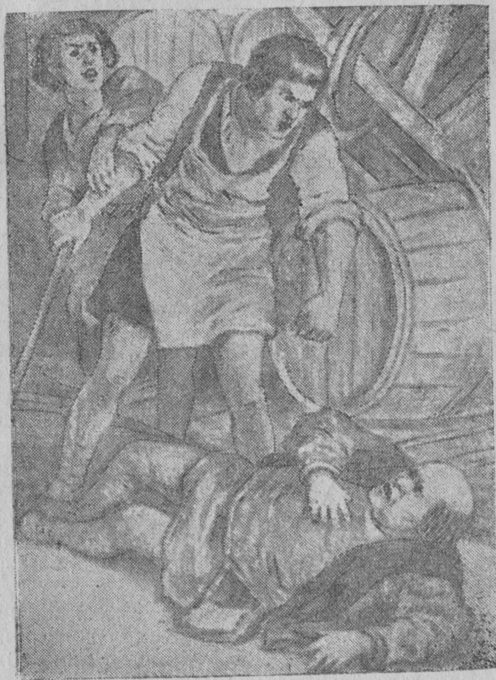
Събкыд да кыз Мартин воштис равновесие да уся джозкѣ.