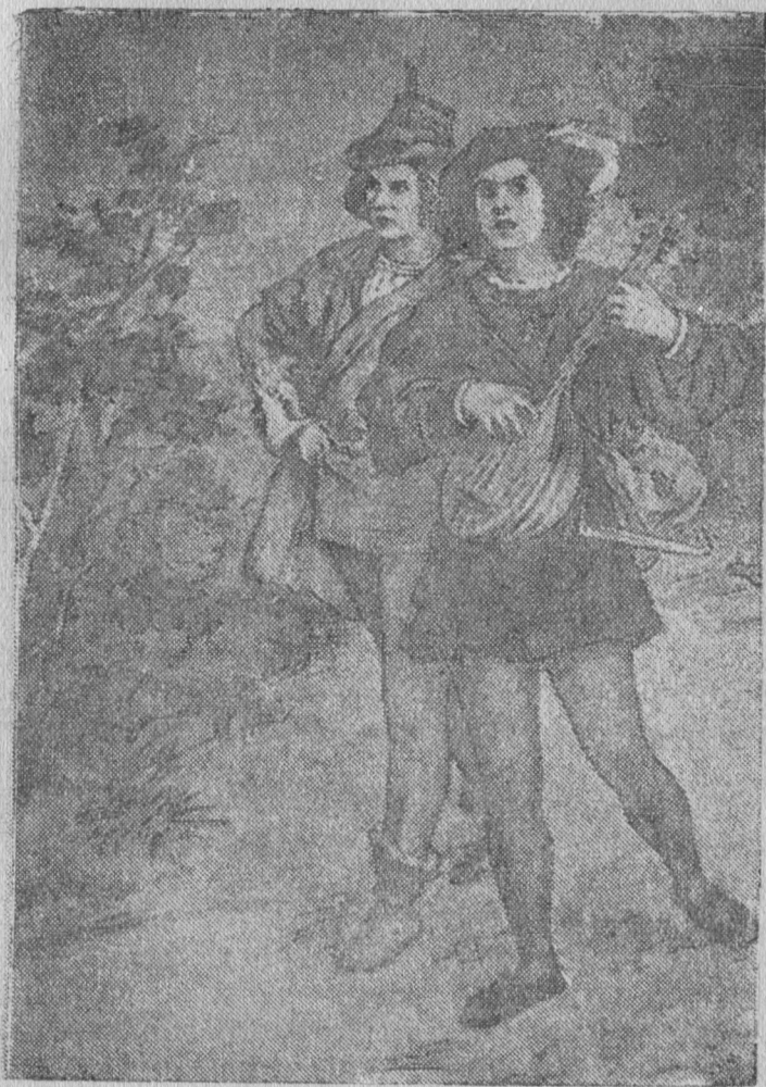
Фридрих да Рейнхольд лютня шыяс улын лэччисны долинаб.