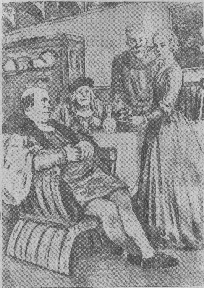
Паумгартнер, Шпангенберг и ачыс мастер Мартин эз веш- тыны бзъяна синъяссö мича ныв выдысь.