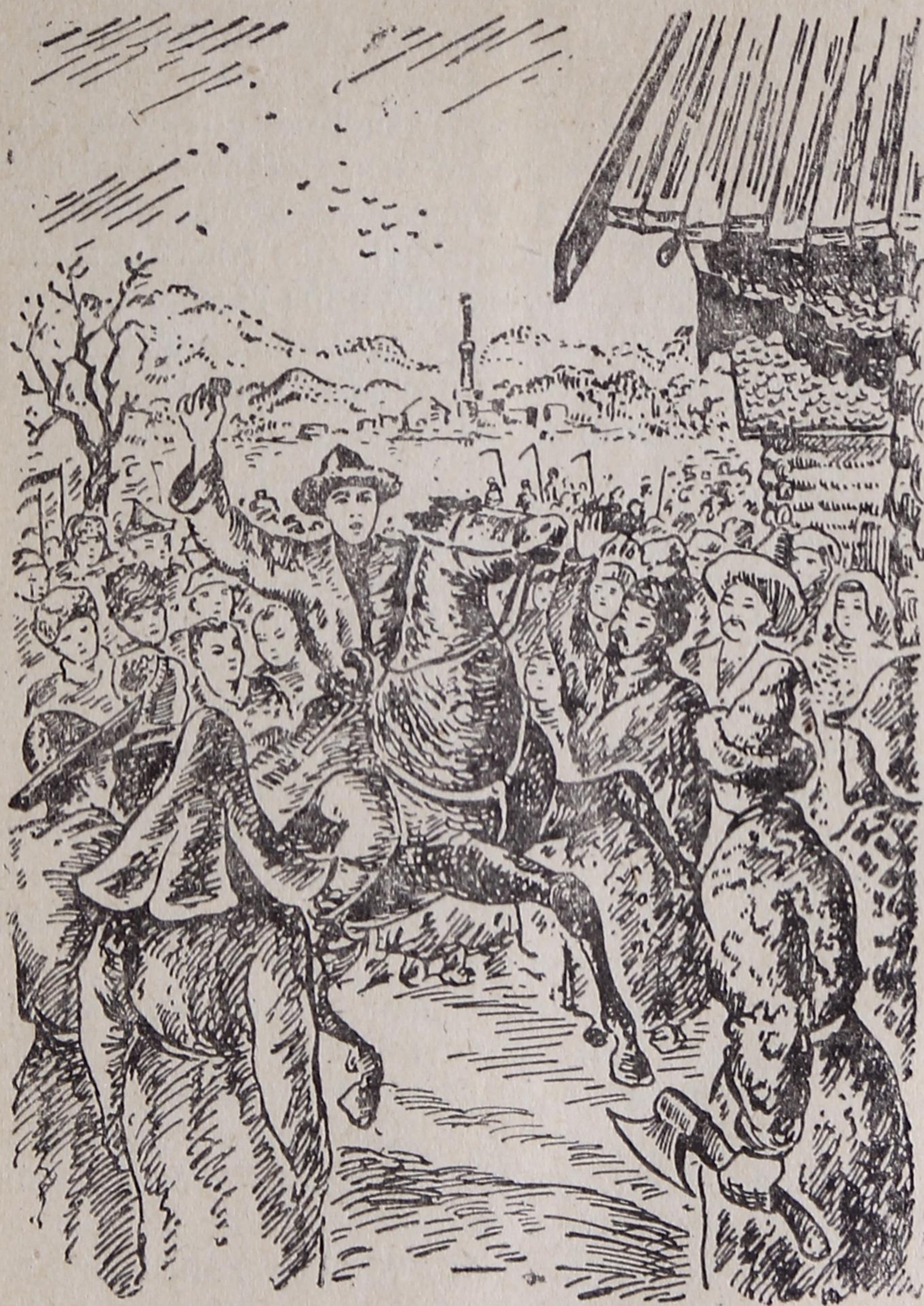
— Тайо шомторйыс сотом башкирской сиктъясысь.