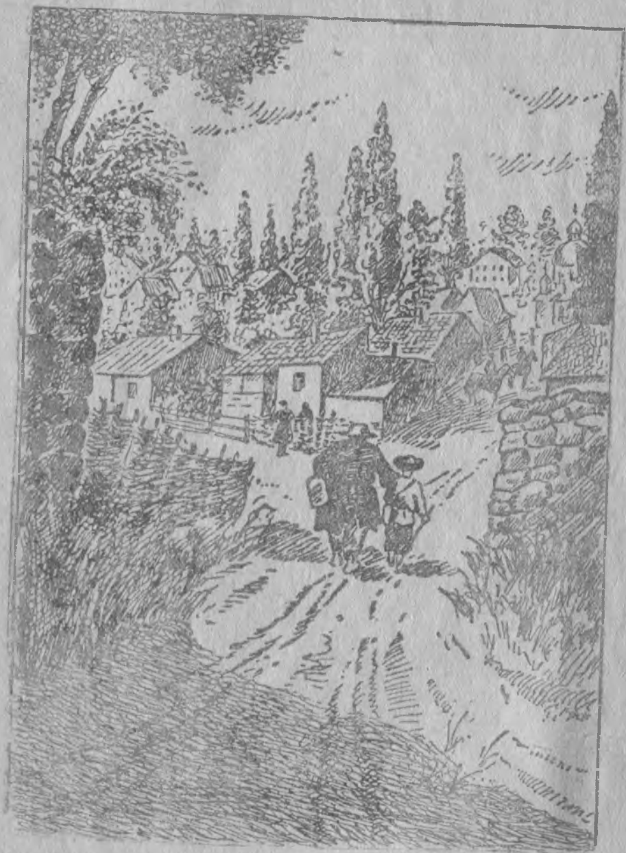
Ва паськѡмыс косьмис туяс взводнѡй пѡсь телѡ вылын.