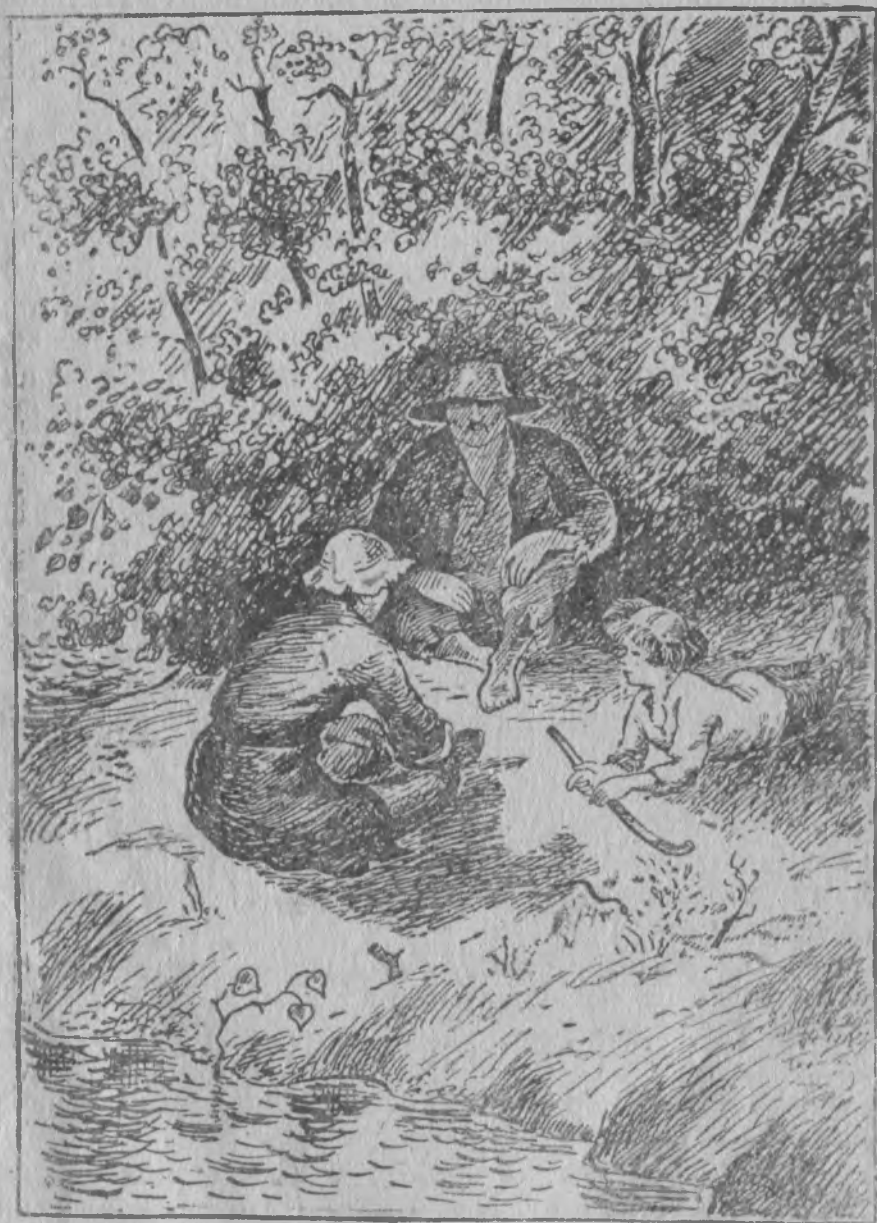
Зон ставсѣ лыддьѡдлѣс шкуринецъясльсь огневѡй вооружениесѡ.