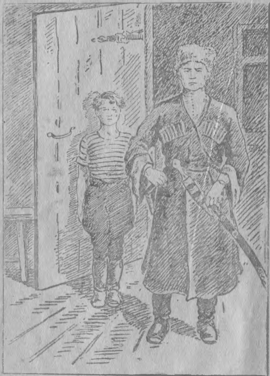
Локтє кнсьѡм паськѡма Володька, Кочубейлѡн радейтанторѡмс.