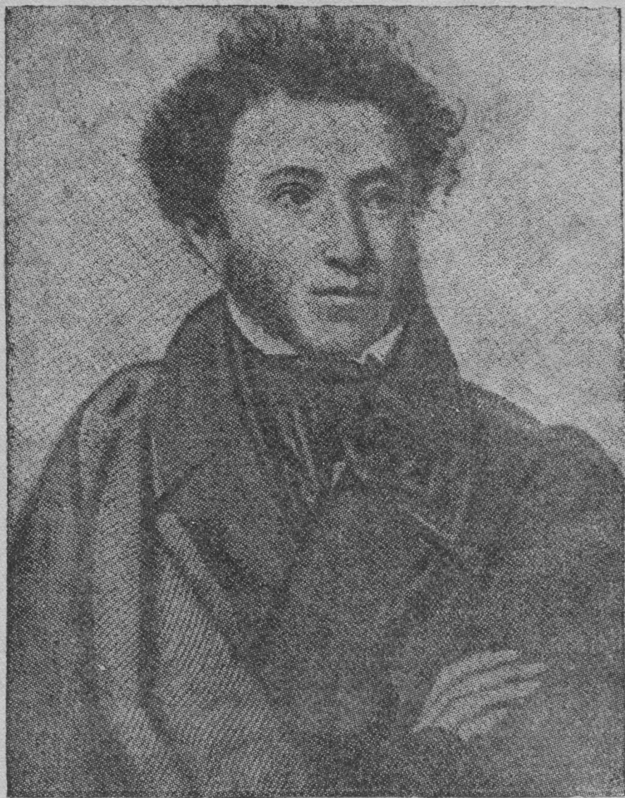
Александр Серге́евич Пушкин (1799 — 1837)