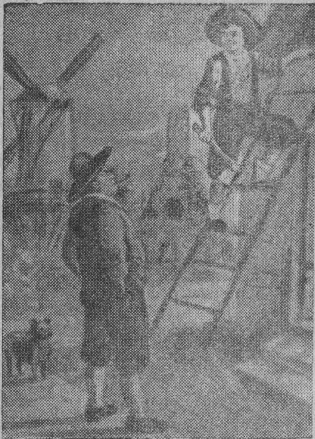
Шонді лэччандор Мельник локтис видэод- лыны, кызэи Ганслён муно уджыс.