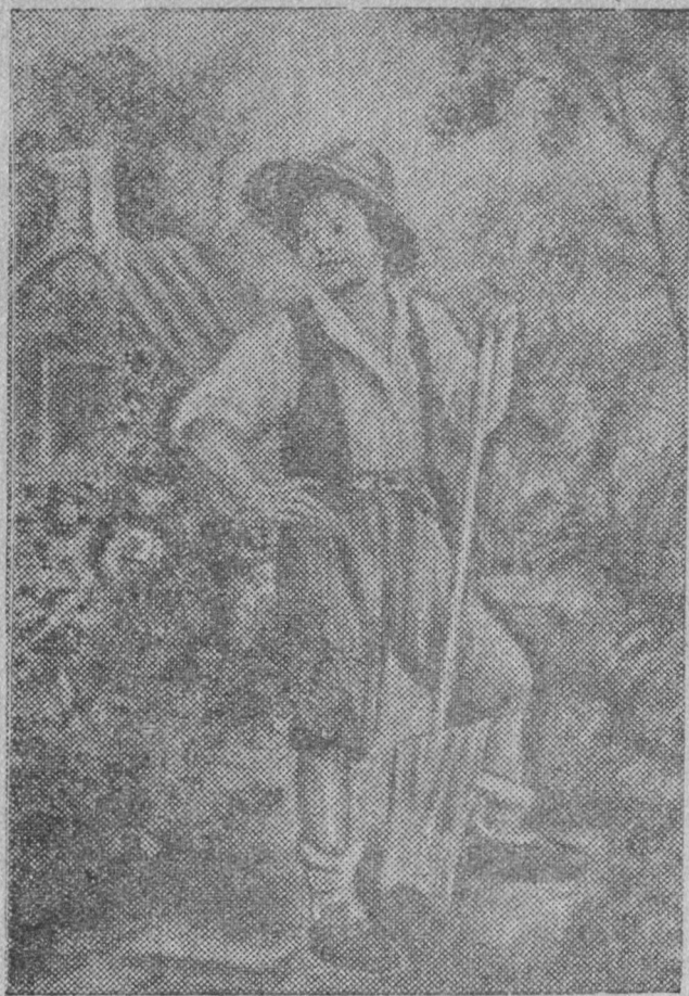
Дзонь лунъясѝн Ганс уджавліс аслас садйың.