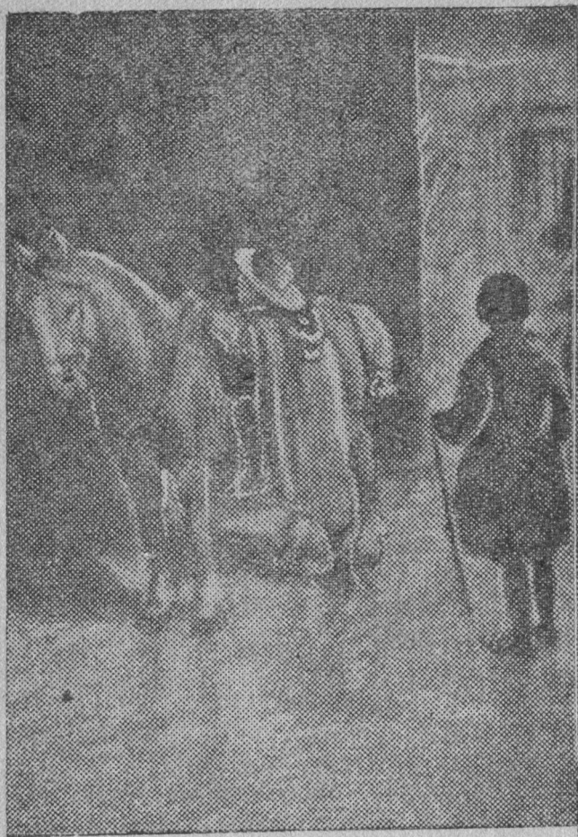
Доктор мѡдѡчис верзьѡмѡн Мельник керкалань.