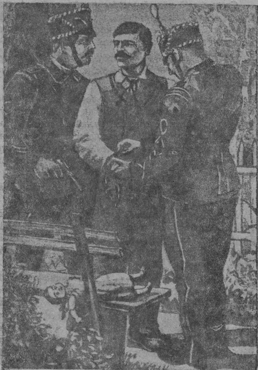
Жандармјас дорисны кјјассѳ чептѳн.