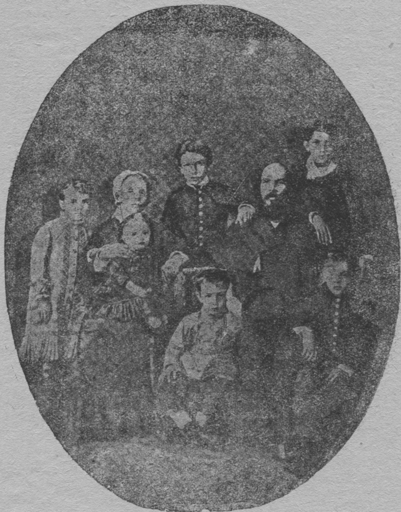
Улановјаслѳн сѳмја 1874-1 воын