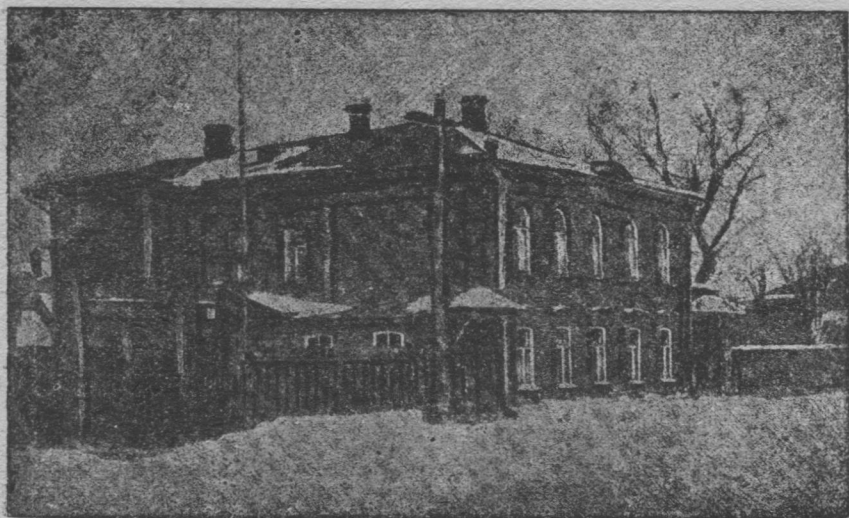
Симбирскын Прибыловскийяң керкаыс, копй В. И. Ленин оліс 5 арбсбз. (Чужіс флігелас).