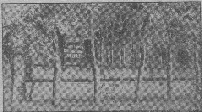
І. Н. Улјановлѡн керка Сѡмбірскынкѡні Владѡмір Ілліч олѡі 1878-д восан 1887-д воѡѡ

Провѡнтсіѡаын олѡгѡн,—Казаньын да Самараын,— тајѡ војаснас сіѡ помалѡс револуціоннѡј образованнѡсѡ. Сіѡ адѡіс асыс вескыд тусѡ—маркѡізмьын, робочѡј класс тышкѡѡмын. Владѡмір Ілліч бура велѡдіс маркѡізм. Маркслыѡ да Енгельслыѡ став сочѡненнѡсѡ лыѡѡіс,—тащѡм нѡгајасыс рочкыс вылад ещѡ вѡлі секітѡ да францускѡј лѡбѡ немѡцкѡј кывјѡн гѡжѡм нѡгајас лыѡѡывлѡіс. Аслыс шѡѡѡѡм знаннѡјаснас сіѡ јукысывлѡіс томјѡз кружоккѡѡ, кодјас ез кужны лыѡѡыны іностраннѡј кывјѡн гѡжѡм нѡгајастѡ. Сіѡ кутѡс велѡѡѡны россіѡјаса олѡмсѡ, мед ескѡ тѡѡмасы — вескыда-ѡ велѡѡѡ Маркс. Тајѡ тусѡ бура тѡѡмалѡм бѡрын сіѡ чорыда тувтчалѡмѡн кутѡс мунны тајѡ тусѡ да аснас лѡѡѡѡм коммуніст партѡја нырнуѡѡѡмѡн нуѡдіс ас бѡрсаыс Россіѡјаса робочѡј классѡс побѡдалаы.