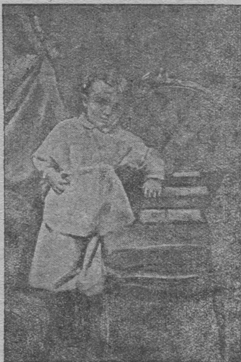
Владимир Ильич 1874-д воын.