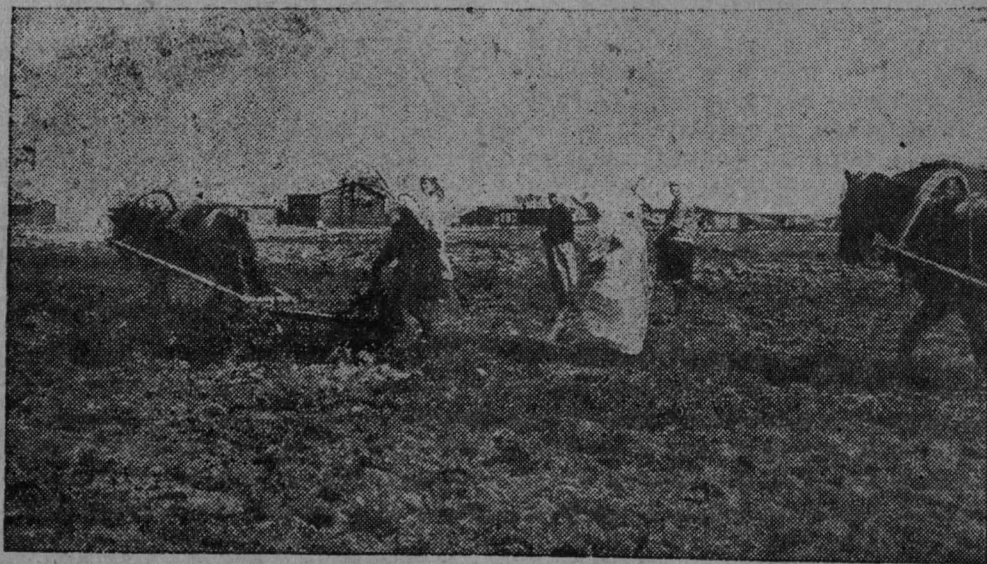
Колхоз на полях.

Наладить систематический контроль над работой руководителей, оказывая им практическую помощь в подготовке и проведении занятий. Совещание считает необходимым