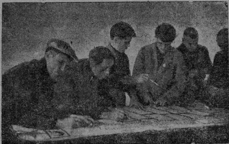
Совпартшколцјас лезбны етенб бшббдан газет.