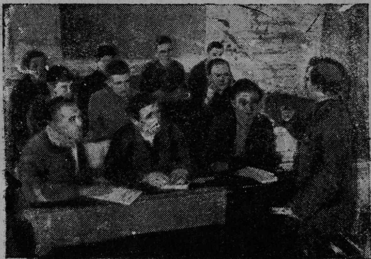
Візін рајонын пропагандастјасёс гётёвётан курс вылын. Велёдысыс—Прогруппаса шлен Јуркін јорт.