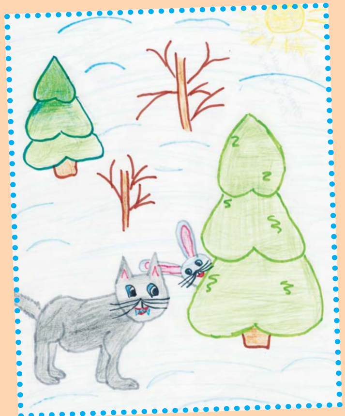
Серпасалис Валерия УТЯМЫШЕВА.