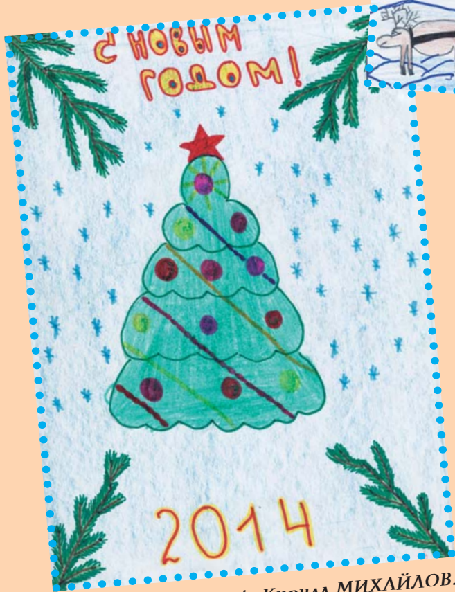
Серпасалис Кирилл МИХАЙЛОВ.