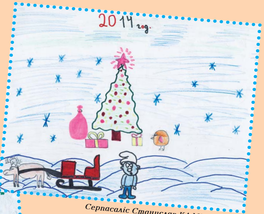
Серпасалис Станислав КАЛИСТРАТОВ.