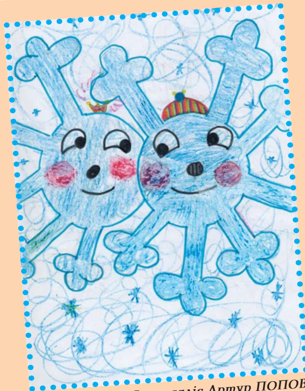
Серпасалiс Артур ПОПОВ.