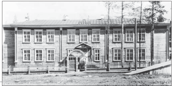
Вылыс Максаковкаса важ школа. Öни тайö керкаас посёлөкса администрация.

1952-öd воын «семилетка» вуджöдöмаöсь кык судтаа виль керкаö.