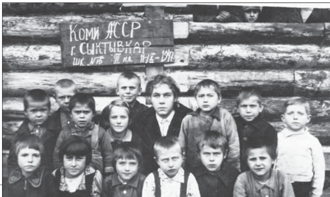
Улыс Максаковкаса велöдчысыяс. 1947 во.

1934-öd воын запаньсянь километра ылнаын паськöдчöма Улыс Максаковка посёлок, кыпалöмаöсь баракгьяс. Сэки заводитöмаöсь татчö воавны мукöд сикт-грездыс войтыр. Öти жырйын сэки оломаöсь 3-4 семьяөн. Узьломаöсь джоджас.