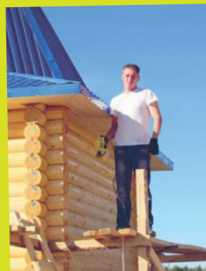
Меным зэв нимкодъ, мый менам олöмын вöліны тайö дас луныс, и найöс ме коллялі ёртъяскöд öтлаын.