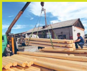
Уджыс меным быттьö шойчöм, ловтö сöстöммöдöм.