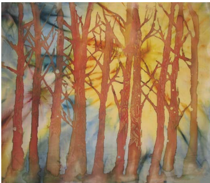
Серпасыс Сыктывкарса 26-ӧд номера школа архивысь.