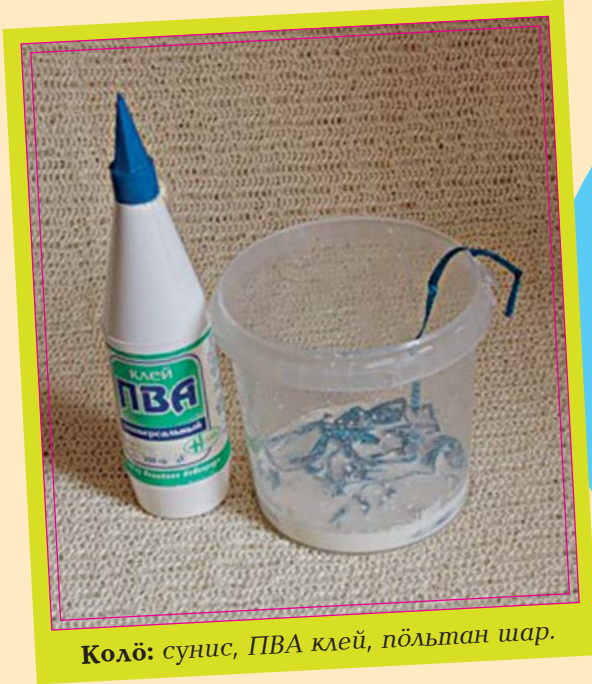
Колө: сунис, ПВА клей, пöльтан шар.

Мыйсянь заводитны? Дерт, шар пöльтөмсянь: кутшөм ыджада колө, сэтчөдз и пöльтны. Бывті кө сук ПВА клейыс, позьö кизьöртны ваён. Удж кокньöдөм могысь позьö кистыны клейсö паськыджык дозйö, сэсся клеявыны сэні суниссö. Öткымынөн вөчöны клей дозмукас кык розь да нюждöдöны сэті суниссö. Суниссö позьö бöрйыны коть кутшөмөс. Верман öти рөм медводз гартлыны, сэсся мөдөс. Гартлөм шарсö кольны косьтыны. Oz ков пуктыны шоныд пач дорö, оз вöйыны и фенөн косьтыны - шарыс потас. Клей косьмөм бöрын колө лэдзны шарсьыс сынöдсö да вöляникысь кыскыны пытшкөссьыс. Со и дась ас киён вөчөмтор - мича да аслыспөлөс шар.