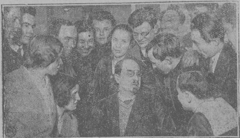
Картина-вылын: Луначарскіј-орт оорытө рабфакөветсјаскөд рабфакјаслы дас во тыртөм-куца лөбөдөм вечер-вылын.