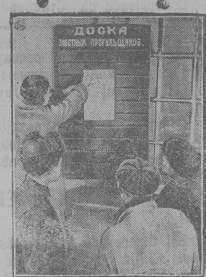
«Чорней доска»-вылө өшөдөдны уж-вылө петтөм јөзлыс өпісоксө.