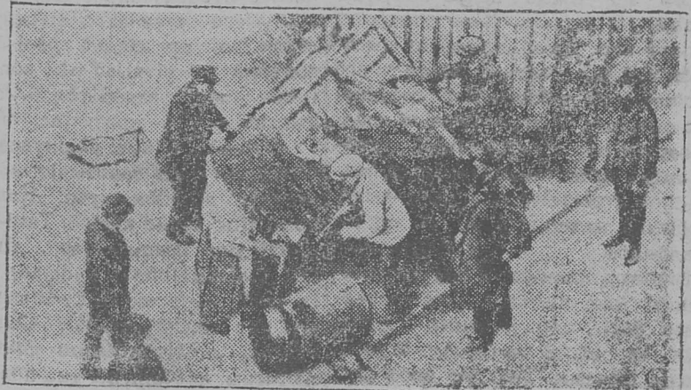
Картина-вылын. Робочөјас вөчөны баррикада.