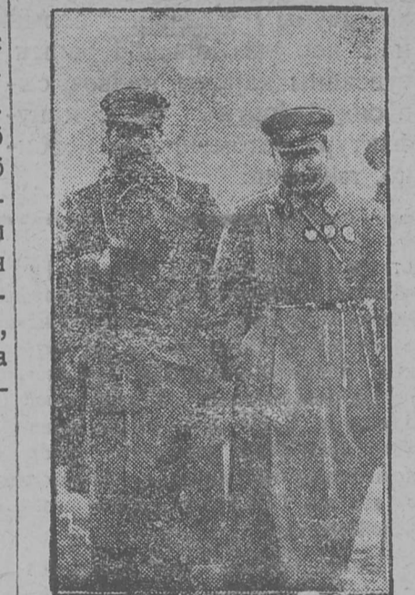
Картїна-вылын Сталїн (шујга- вылас) да Бубонїеј (вєскыдылас) Краснєј площада - вылын парад- ббдас.