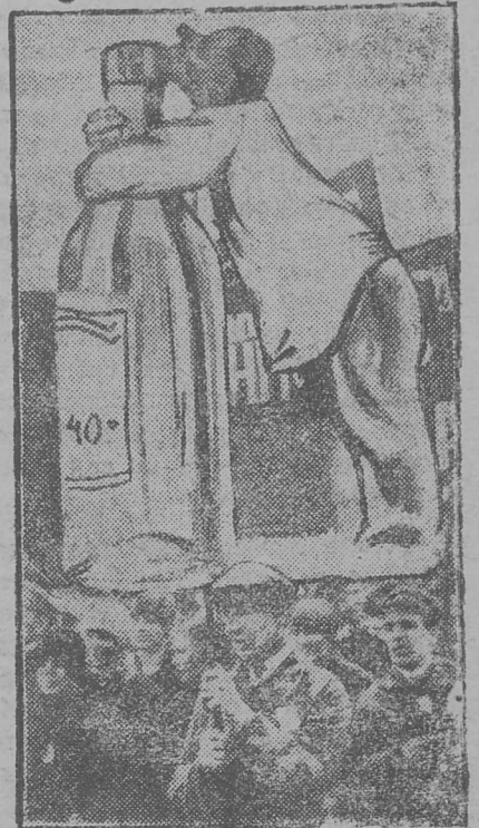
Демонстрация-вылын зев уна платат-макетјас. Картина - вылын платат-макет - прогулщйк6н ра- б6јтанторјас.