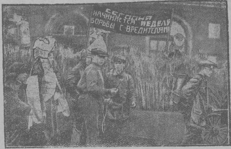
Осоавиахим нуоддө вожон вредительскөд вермасом-могыо.