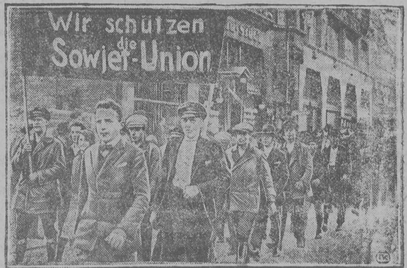
Берлїнса пролетарїатл6н 6монстратсїја. Знамя-вылын гї- ж6ма: „мї дорјам С6вет Сојуз“.