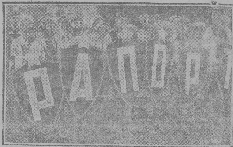
Украинаса дөлегатсја рапортујө сөлотысы.

АНГОРА. «Мөльист» газет лыс-дө, рөч ізшөм-пө туртөсјаса дорыс јонжыка мунө турөтскөј рынок вылын дај став Сред-өзем-нөј морө гөгрөс. Рөч ізшөм-пө туртөсја а дорыс дөнтөмжык.