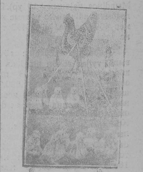
Сынамо стабөонын воөөс пөнө р-јаслөн слөт. Картина вылын: карнавалнөј груп-па «Курбг курбг-пөјаныскөд».

Мөскуа. Август 22 лунб Нар-өднөј Комөссарјас Сөветын за-сөданнө вылын председатөла-лис Сыртсөв јөрт. Тајб засөдан-нө вылын гөгрөбок вөдлөлисны да сорнөтисны школајасө агро-номөзатсја уж (агрономөчөскөј наука) сугдөм жылыс да крөстө-на том јөз школајас жылыс до-клад кузө. СНК засөданнө вөд-лө вөисны Ставсојузса пөнөр-јас слөт вылыс представөтелјас. Пөнөрјаслөн засөданнө вылын щөц ужалөм да сорнөтөм јона кажөтчөс засөданнө вылын во-лысјаслы. Крөстөна том јөз школајас (ШКМ) уж жылыс да өктөса школајасө агрономөзатсја уж сугдөм жылыс доклад вөчөс Экөтөл јөрт. Сјөб вөстөлис: крө-стөна том јөзсө вөдөдөн шко-лајаслөн-пө рөлыс вөк өтарб ыкыдб. Школајасыс отсалөны өктөса өвмөслө кыптыны да сөтөны коллөктивјас оргөнизү-тысөсө. Воэынжык доклад вө-