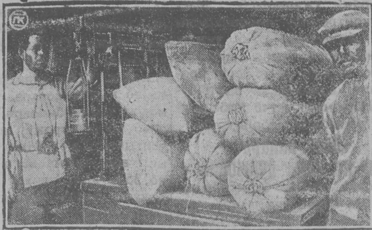
Һань чукөртанынын выл һань примитöны.