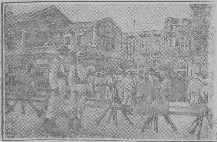
Легипетан да Англијасањ век öтарö войны Пелесетинай выл војска-яс, самолетяс да брөкөвијяс. Англијаса милитаризм жонмөдö асысө властөс вöр лөзöмөн да карјас сөтöмөн.

— Шанхај Агенство Го-Мин јуöртö: Харбинö воис выл парти-ја Асыввыс Китајса көрттуј вы-лыс арестуйтöм служашцöдяс-öс, 136 морт.