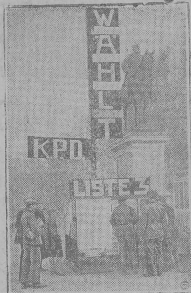
Агїтїрујтан лозунҗас Краснөј Нојкельнын (Берлїн бердын) Го- гентсөлөри памјатнїк дінын.