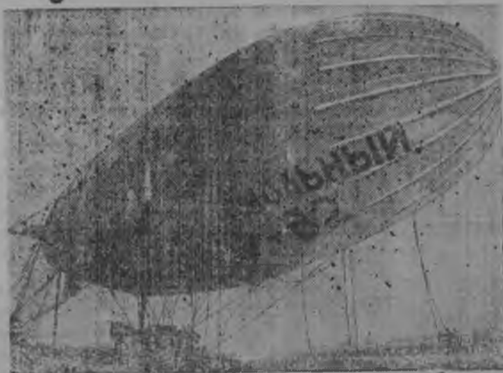
НА СНИМКЕ: Дирижабль „СССР—В-2“—один из двух, отправленных для помощи челюскинцам.

Советское правительство принимает энергичные меры для спасения челюскинцев.