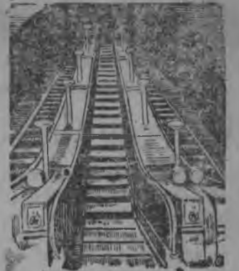
НА СНИМКЕ: один из эскалаторов (движущаяся лестница) Московского метро.

На опытном участке Сокольники—Комсомольская пл. уже курсируют первые поезда.