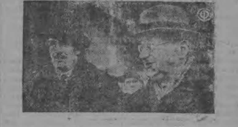
В конце марта Москву посетил министр-лорд-хранитель печати А. ИДЕН в сопровождении ряда видных чиновников англ. министерства иностр. дел. Иден был принят т. т. Сталиным, Молотовым и имел несколько длительных бесед с т. Литвиновым. НА СНИМКЕ: англ. министр Иден с т. Литвиновым.