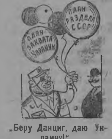
Беру Данциг, даю Украину!

Маслопромысл дајасө промын ужалыс профсөјувникјас, крајувса аэроморскөј клуб стрөитөм былө пунктөм лундн жынјөна уж дон 100-шайт да корбны ас бөрсаныс вөтчыны рајсөполкомса, рај-30-са, поштаса да финбанковскөј месткомјасыс профсөјувникјасөс. Өитов.