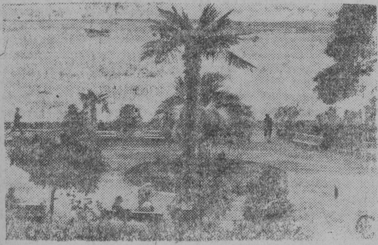
Выл Сухум. Сөртас вылын: набөрежнөј валан булвар.

мыј «ми мөдам бид лун пөркөдә лунса норма выпөлнәјтны 150 процысө не өщажык да стахановскөј өама уждн март 25 лун кежлө не сөмын тыртам вөр өкспорт программа кералөмдөн і кыскөмдөн, но і сөтам сөдтөд 800 кбм. вөр.» Хожаиноз.