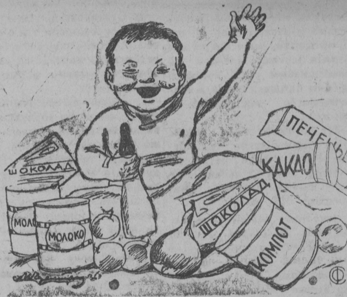
Работу Наркомпищепром одобряю целиком и полностью.