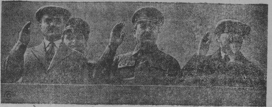
Первомайский парад на Красной площади. НА СНИМКЕ: т. т. Сталин, Мэлотов, Калинин и Димитров на трибуне.