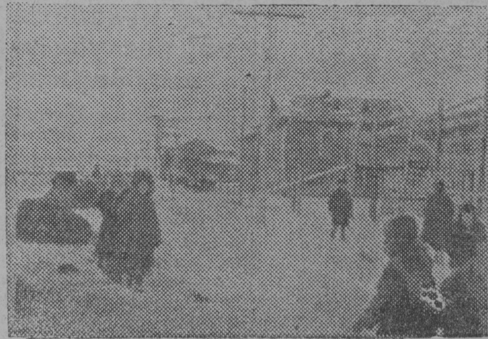
Уст-Усалџн обшџшџ вїд