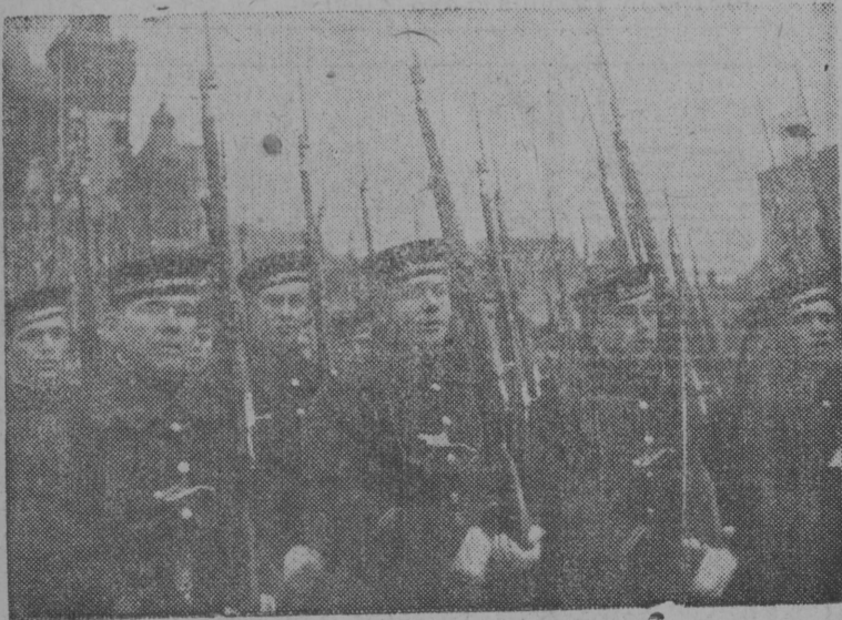
Гөрд Армия демонстрация вылын

Мед олас Маркслөн— Энгельслөн—Ленинлөн великөј непобөдимөј знамја!