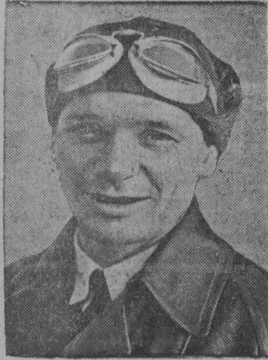
СССР-са Верховнөй Советса депутат лотчик—высотник В.К. Коккінакі

Авиација лунө став страна, став советскөй народ пөса чолөмалө НКВД-өс да сылыг вескөдлысөс, Сталинскөй ЦК-лыг посланецөс, Н. І. Јежов јортөс, коді кујис ердөдны да пөш-