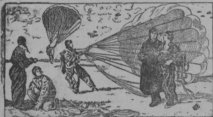
„Парашутисткајас“—картина художник П. І. Соколова-Скалалөн.