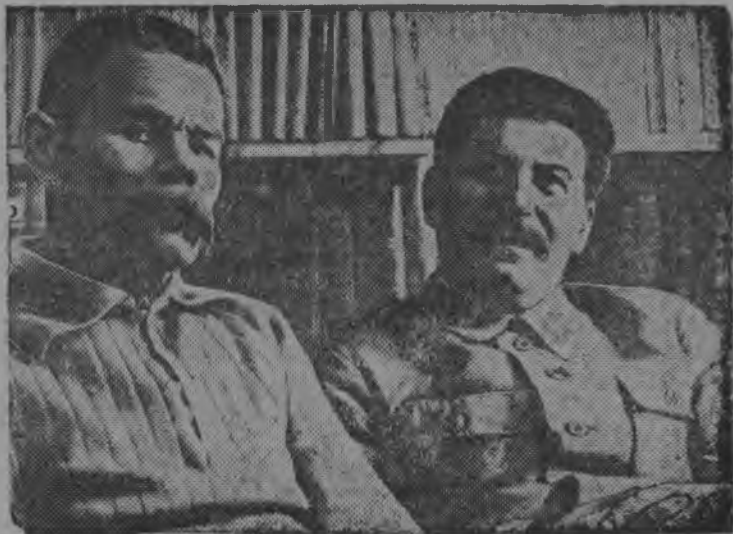
І. В. Сталин да А. М. Гор'кіј.