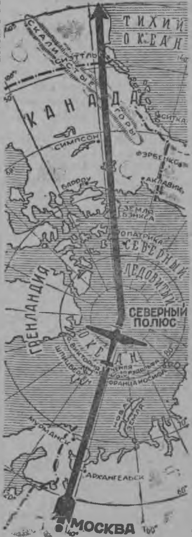
Беспосадочнӧј перелетлӧн трасса

Советскӧј Сојузса геројјас Чиаков, Байдуков да Белаков јортјаслӧн Москва—Севернӧј полус—Севернӧј Америка маршрут куҗа беспосадочнӧј перелет.