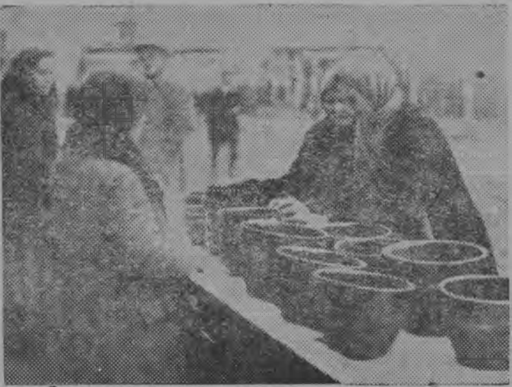
Снимок, вылын: межрайоннөй јармарка вылын вүзасөны.

Царскөй россияса быд 10 сурс рабочөј вылө вөліс 325 несчастнөй случај 3 луныс унжык трудоспособност воштөмөн. Тајө рабочөјјасыслөн пөшти вөтөд јукөныс пөлучајтлис немөвөјса инвалидност.