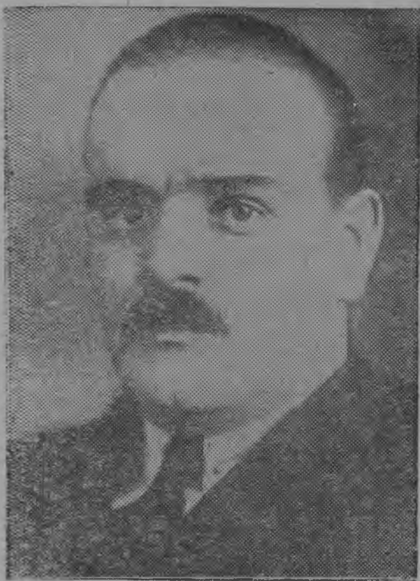
Националностјас Советө депутатө кандидат Свердловскөй избирательнөй округ куза—Николај Михајлович Шверник јорт