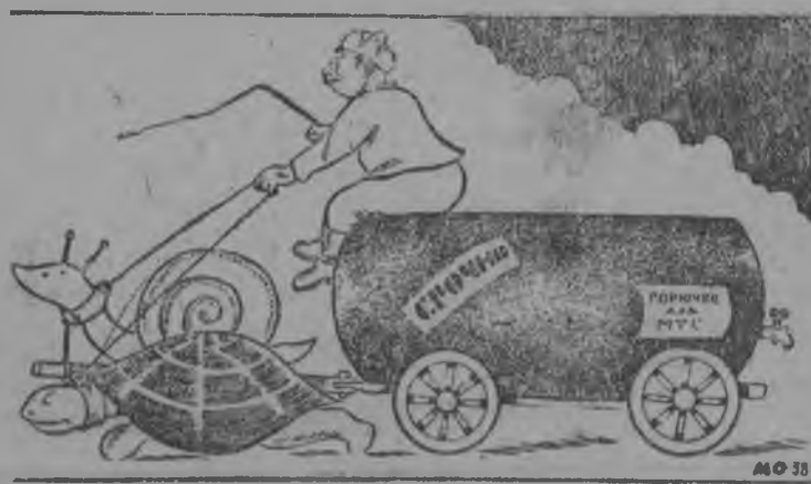
„Јона термасбмбн“ Таці вајалбны тулыс кежлб гор'учб Палса МТС-ын.

Кујбд план сертн колб петкбдны 4000 дод, а петкбдбма сбмын-на 130 дод, пбјим 47 центнер пыббд чукбртбма 3 центнер. Кералбма 1050 пощ, а ставсб колб 12000 пощ, нібтык мајбг-на абу кералбма. Инвентар ремонтіуртбм оз мун. Болотов.