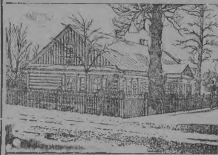
Мїнскын Сбветскбј улїца вылын керка, кбнї мунїс РСФСР-лбн 1-бј сїезд (1898-бд вбса март). Грїбовскбј фотбмыс рїсунок.

Вбр менам участокын шбркоб—поснїд і гырыс. Пбрдба технїческбј условїе сертї—дорыв, сузсана пу ставсб пбрдбма. Первбј локта пу дорб да кы-