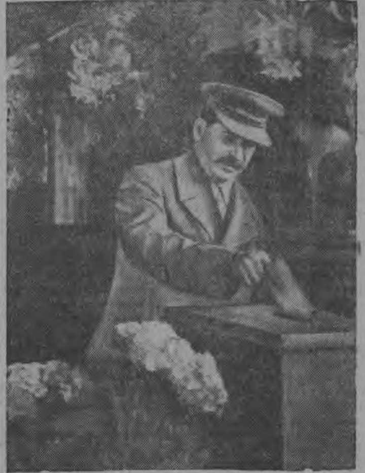
Москваса Ленинскօј избирателнօј округса 58-օд избирателнօј учасокын. І. В. Сталин јорт избирателнօј урнаօ лезօ бјуллетена конверт.

Вылын организованност, турун ідралан ужјас жеңыд срокјасօн да вылын качествоօн нуօдօм,—со мыј должен лоны торјалана чертаօн тавоса турун ідралан ужын.