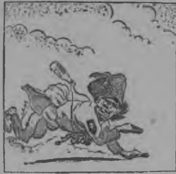
„Краснõй Армија чорыда нõјтлїс кулацкõй атаманја- сõс“.