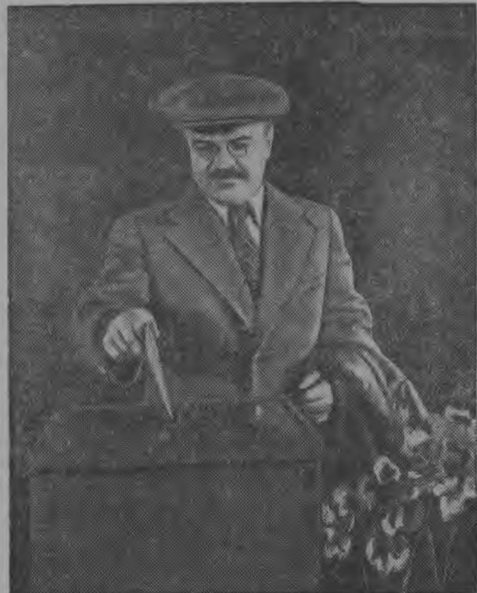
В. М. Молотов лезօ бјуллетендн конверт избирательнօй урна.

1. ВКП(б) Коми обкомлн օтчот. 2. Ревизионнօй комиссијалн օтчот. 3. ВКП(б) обкомлыс состав бօрјѳм. 4. Ревизионнօй комиссија бօрјѳм. Та вылын рытја заседаніје помассօ.