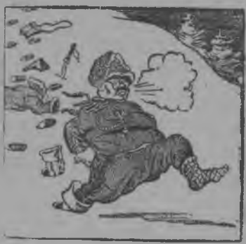
„Краснõй Армија чорыда нõјтлїс јапонскõй интервент- јасõс“