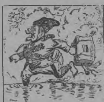
„Краснõй Армија чорыда нõјтлїс белõй генералјасõс“ (Б. Је. Јефїмов карикатурајасыг)