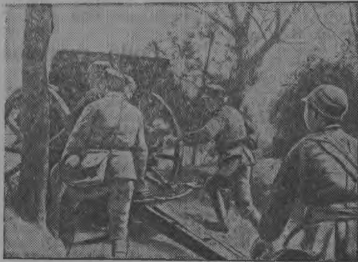
Снімок вылын: Китајск артиллеріја позіціја вылын.