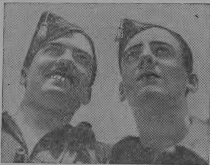
Снїмок вылын: Том лөтчикјас вїдөбнү республиканскөй самолетјас лебзөм бөрга.