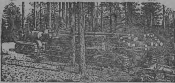
Серпас вылын: Шіглінкбј механизириованнбј вбрпунктын (Вологодскбј област) гожбмын тракторбн вбр кыскалбм.