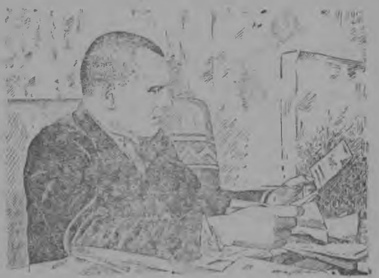
Снимок вылын: СССР Верховной Советса депутат Ф. И. Гринько, Молотов нима колхозын председател, (Шипуновской район, Алтайской край) быд лун пёлучайтё аслас избирательяслысь 10—12 письмёён. Ф. И. Гринько ёрт видлалё воём письмёяс.

* Тёдчымёвја паскалё Ленинанской текствильной комбинат. Помалёма 1.582 станок вылё мёд ткацкёй фабрика стрбитём. Монтируйтёс 76.104 чёрс вылё выль печкан фабрика оборудуйтём. Сийёс ледёмён комбинат кутас быд во сетны 30 м миллион гёбр метр бжа.