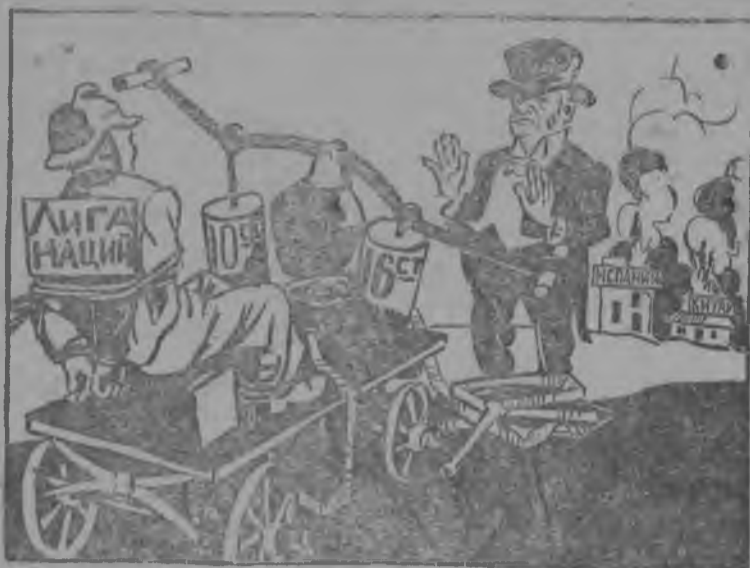
Вот нбжарыс дугдас, сэки ті верманыд заводитны удж.

лі вбтлдма. Сіјб-жб лунд кујм італјанској самолет бомбарірујтисны Гандіа (Средземној море побереже вылын порт. Валенсјасан асывлунвыпанын). Ембс жертвајас.