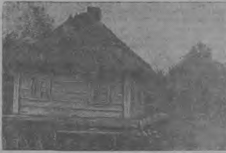
СНИМОК ВЫЛЫН: Вбвлбм панской Польшаын белорусской голь крестьянинлнбн типичной хата.

Ми гбгбрвоам, мый ино- странной агентствояслы по- ручитбма найб кбзыевабн нудбны советской войскалы паныд пропаганда. Найб и нудбны тайб «пропанда- сб», лживой измышлениеяс- лыс чукбр нагромождйтб- мбн, медым оправдайтны ассыныс существованиесб. Но мый сулалб пропаганда, кодбс подулалбма не факт- яс вылын, а пбръясбм вы- лын? Систематически пбръ- явлыны общественной мне- ние—не таын ли «пропанда- да» «цивилизация» дор- йысыаслн? Ми эгб дума- йтбй, мый иностранной прессалн представительяс вермасны усыны сэтшбм улбдз.