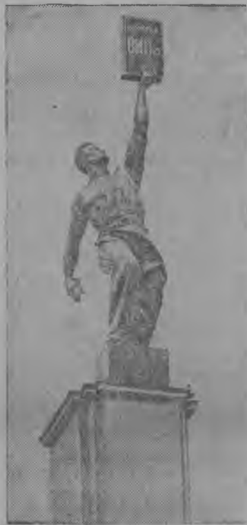
СНИМОК ВЫЛЫН: Ставсоюзса сельскохозяйственной выставка вывса Печать павильон дорын установитом скульптура.

Ленин олом да революционной деятельность йылысь январь 21 лунь районса став колхозьясын, Нювчим заводын да вбр участкасына лосны докладьяс. Тайб докладьяссы вбчдм вылб гбтвйтчдны нин специальной докладчикьяс.