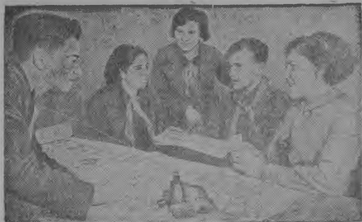
Ленинскѳй районса 153-ѳд школыны (Москва) комсомольскѳй организация велѳдчан во заводитѳмьяс ѳ мортъсыс быдми 30 мортѳдз. Комсомол радъясѳ примитѳма велѳдѳмын медбур отличникьясѳс.

Снимок вылын—редколлегия гѳтѳвитѳ школьной стенгазета „Сталинецлыс“ очередной номер.