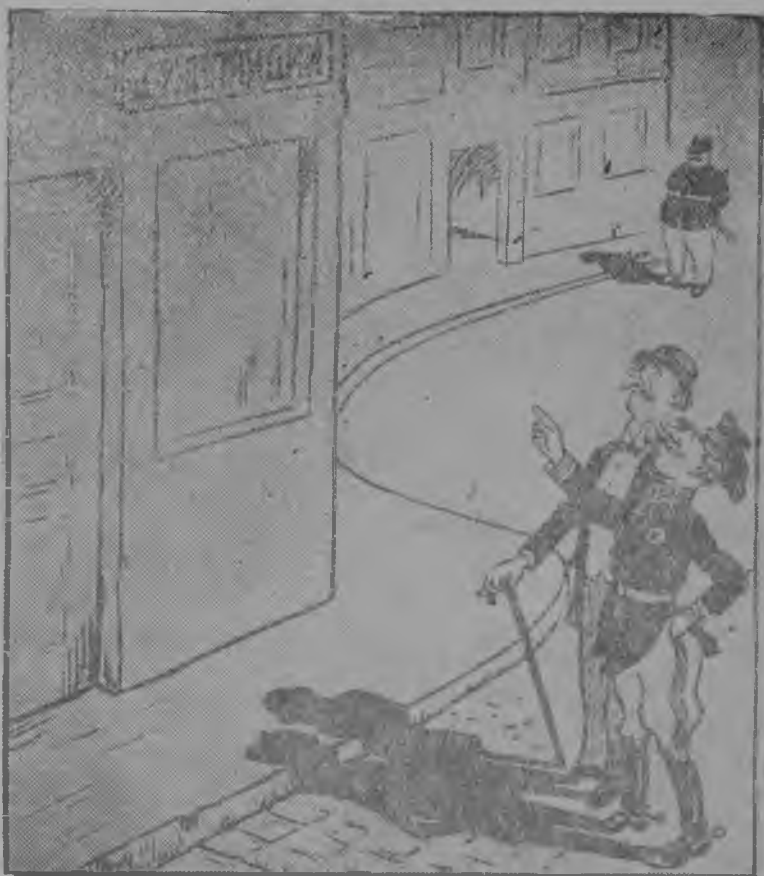
Парижын Анри Барбюс нима улица переименуйтисны Польша улицаб. Вайян-Кутурье улица—Финляндия улицаб. Польской генерал: Сидзко регыд кутам тани чолбмавын финской коллегаясбс. Фото-клише.

Грипп кб прбйдитб кокниа, осложнениестбг, то висббмлбн став признакбгясбс бырбны 4—6 лунысь не сбрбнджык. Но век жб здоровье тырвыйб восста-