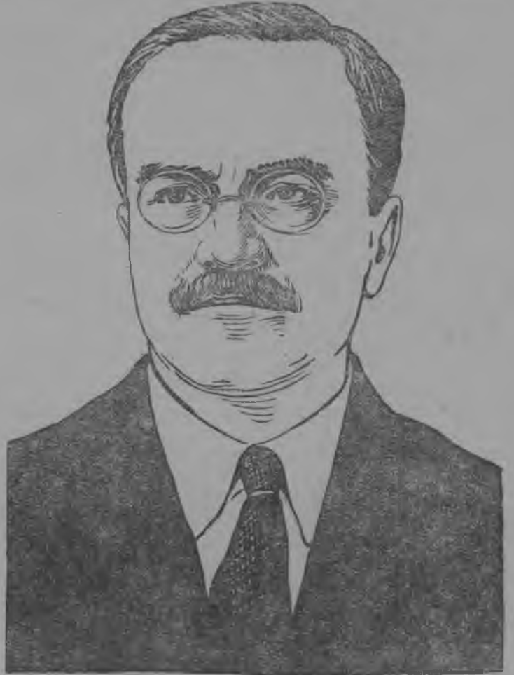
Вячеслав Михайлович Молотов

Миян авиация нүдöс активнöй действиеяс противник войска кузя, сзки уськөдöма противниклысь 15 самолет.