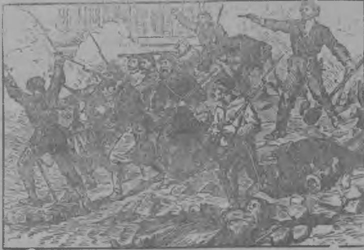
Парижской коммунаръяслön медбöръя бой (1871).