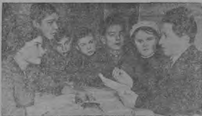
Снимок вылын: ВЛКСМ Траусской райкомса пропаганда да агитация отделысь юралысь Бакланов косультируйтö „Пахарь“ колхозса комсомолецъяссö. (Тульскöй область).