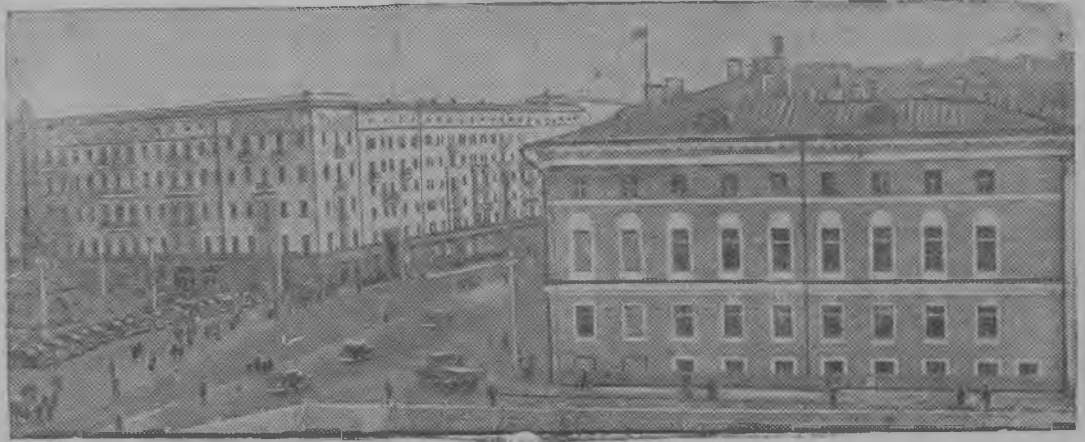
Горький нима улица вылö вид да Советской площадьлөн пельöс. Веськыдвылын—Московской Советлөн здание. Шуйгавылын—выль керкаяс.

„Медым обеспечитны вылын качества продукция лэдзöм, колö технологической процесс правильнöя котыртöм да чорыд дисциплина. Именно тани заложитöма качество вöсна тышын успешлысь важнейшей условие“. („Правда“ передовöйысь)