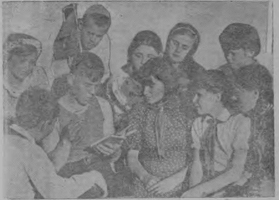
СНИМОК ВЪЛЫН: Часса пионерской лагерия пионеръяс-лбн отряда совет.