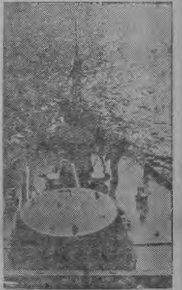
Амурской краснознаменной флотилияса корабляс походын.

Откымын корабляс вылб котырбма уджалысь йбзлысь экскурсияс.