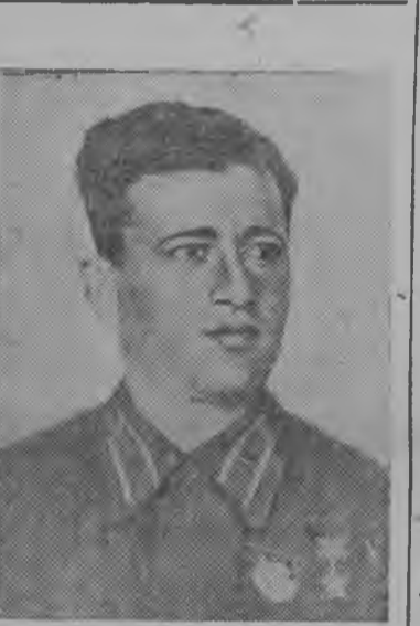
СНИМОК ВЪЛЫН: Советской Союза Герой младшбй лейтенант Григорий Михайлович Айперетян.

— 100 метра расстояние ме котбрти 12,3 секундн, километра—2 минута да 56 секундн, кузъя чечышти 5 метра, судга—1,25 метра, сдایتи нормаяс гребля, плавание, гранатометание да спортлбн мукб видъяс кузья. Таысь ме получити значок „ГТО“.